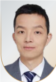
周俊杰 李泽楷讲席教授