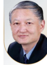
陈国青 清华大学文科资深教授

积极组织行为学、幸福科学、文化价值观与组织行为（基于大数据研究）、跨文化沟通与谈判