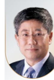
白重恩 弗里曼讲席教授、院长

1983 中国科学技术大学学士 1988 美国加州大学圣地亚哥分校博士 1993 美国哈佛大学博士