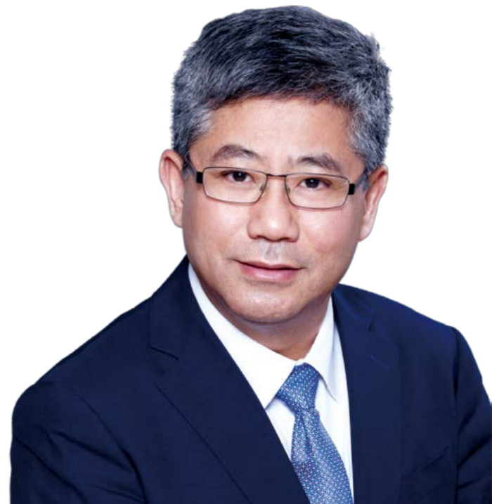
白重恩 清华经管学院院长 2018 至今