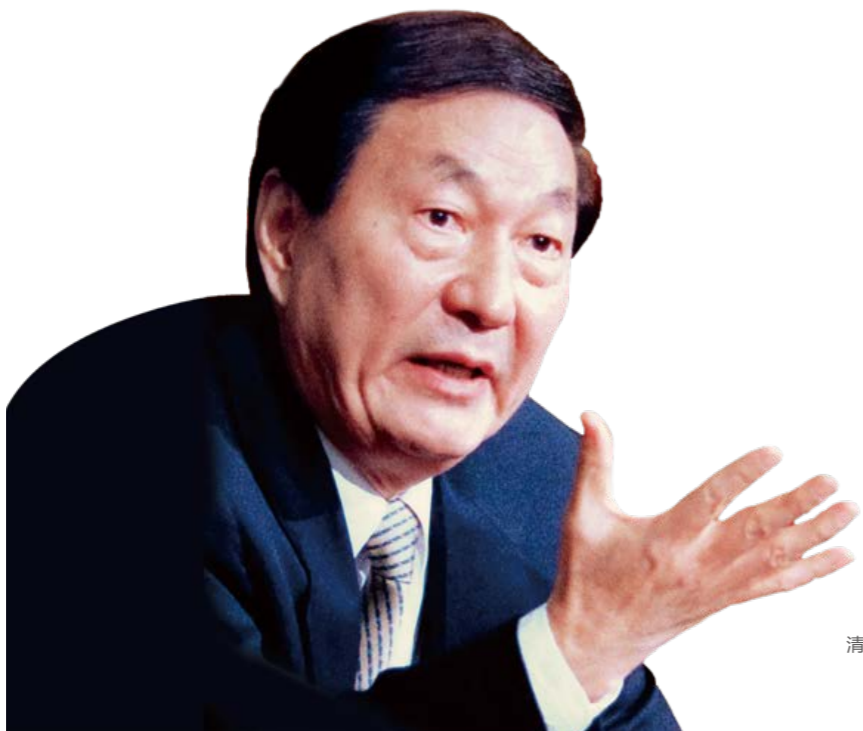
朱镕基 清华经管学院首任院长 1984—2001

清华大学经济管理学院从1984年成立至今,在历任院长的领导下,经过全体教职员工的努力以及校友和社会各界的帮助,学院取得了很大成就。随着国家发展进入新时代,学院需要做出新的努力。改革开放40年来,中国经济的发展取得了举世瞩目的成就,但是中国的经济管理学界还需勇于大胆创新,同时坚持学术高标准,从学术上讲好中国故事,从中国经济管理的实践中发展出对经济管理学有突出影响力的学术成果,并将这些学术成果与人类知识宝库中的其他成果有效结合,培养出更高质量的人才。学院愿与全国同行和社会各界一起推动此事业,为人类知识的发展做贡献,为和中国和世界的发展做贡献。